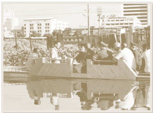
เสด็จพระราชดำเนินไปทอดพระเนตรความก้าวหน้าโครงการบึงมวกะสัน เมื่อวันที่ ๘ มิถุนายน พุทธศักราช ๒๕๓๐