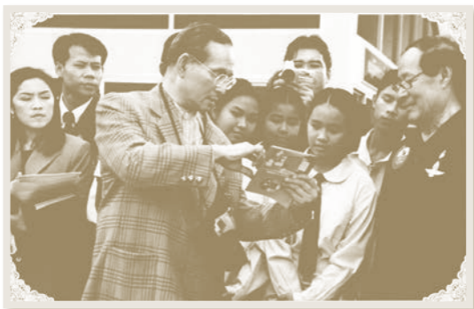
ทรงสอนนักเรียนวังไกลกังวล