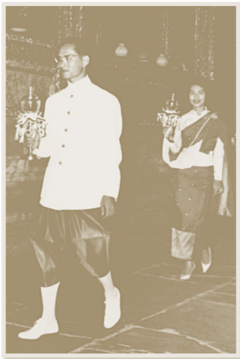
ทรงเวียนเทียน เนื่องในวันวิสาขบูชา ณ วัดพระศรีรัตนศาสดาราม