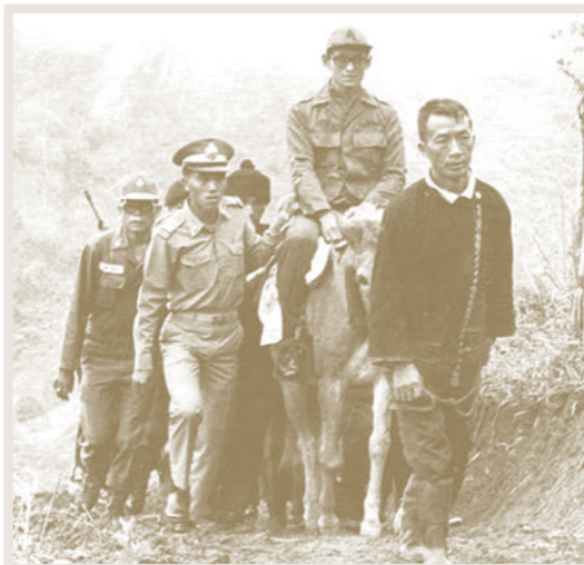
เสด็จพระราชดำเนินไปทรงเยี่ยมชาวไทยภูเขา