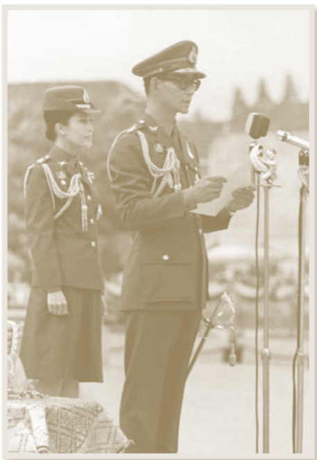
พระราชทานพระบรมราโชวาท ในการสวนสนามแสดงแสนยานุภาพ ของกองทัพไทย เนื่องในพระราชพิธีรัชมังคลาภิเษก วันที่ ๘ มิถุนายน ๒๕๑๔