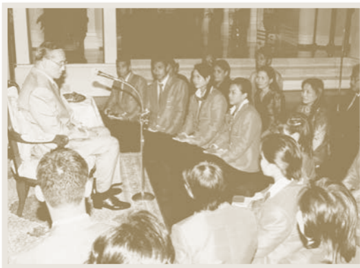
เสด็จฯ ลง ณ ท้องพระโรงศาลาเริง วังไกลกังวล จังหวัดประจวบคีรีขันธ์ พระราชทานพระบรมราชวโรกาสให้นักกีฬาโอลิมปิก เข้าเฝ้าฯ เมื่อวันที่ ๙ กันยายน พุทธศักราช ๒๕๔๗